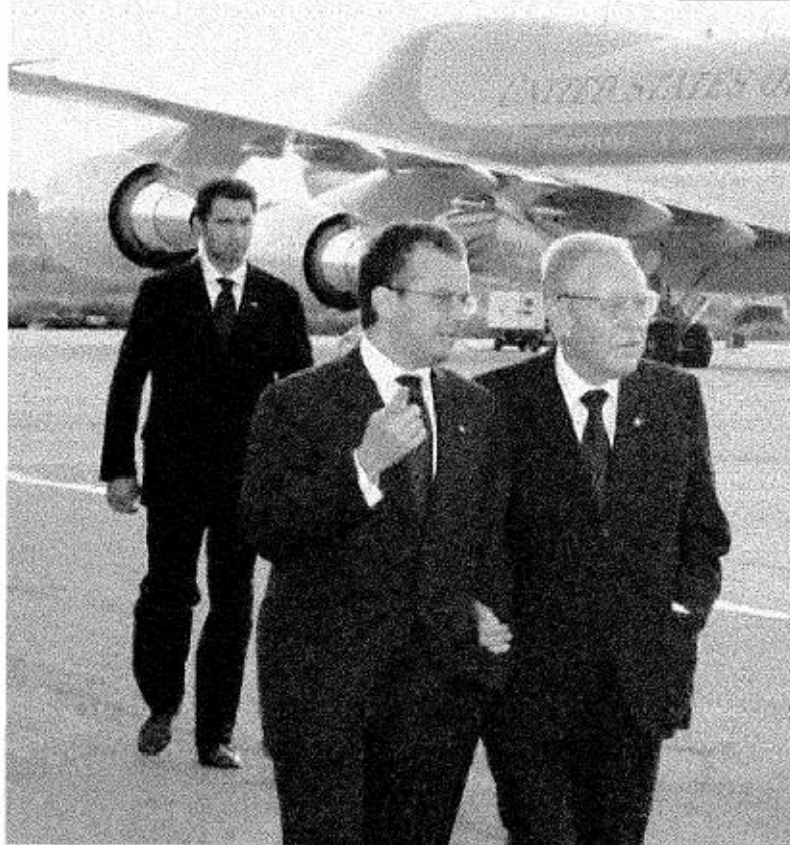
Paolo Peluffo a braccetto con Carlo Azeglio Ciampi: nel libro il portavoce rivela molti retroscena interessanti

Ciampi cancellò l'ipotesi di una cena di gala con centinaia di invitati. Scelse un menù ligure, buono ma sobrio