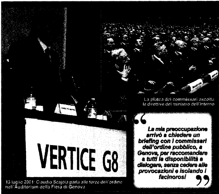
La platea dei commissari ascolta le direttive del ministro dell'Interno