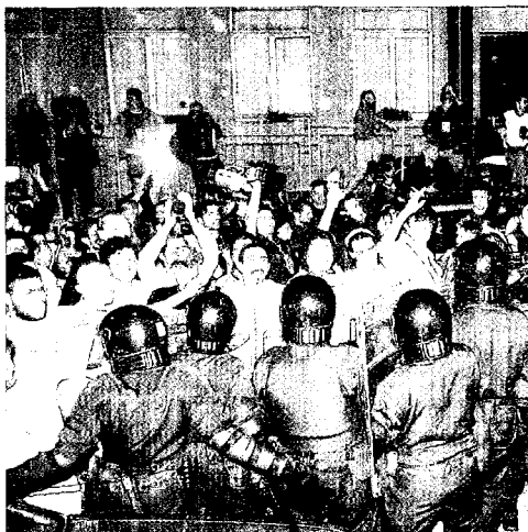
Il blitz notturno del 22 luglio 2001