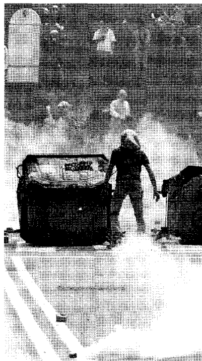
Scontri per le strade durante il G8