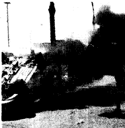
La città fu devastata durante il G8

In sostanza: per il primo cittadino di Genova la sentenza di ieri mattina, che a tutti i li-