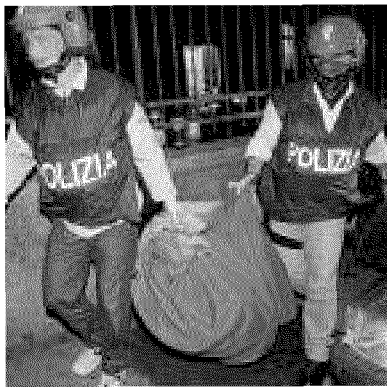
Oggetti sequestrati nel blitz Diaz