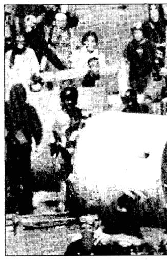
SCONTRI IN VIA TOLEMAIDE