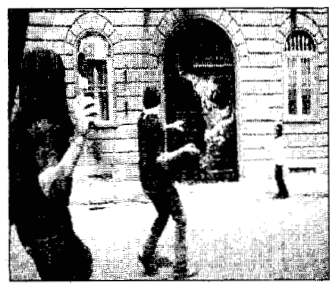
ATTACCO AL CARCERE DI MARASSI