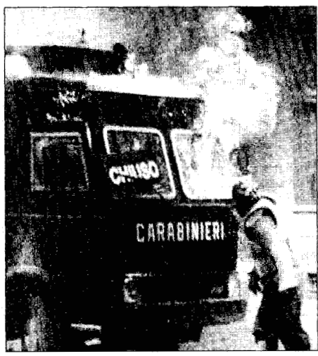
UN MEZZO DEI CARABINIERI IN FIAMME