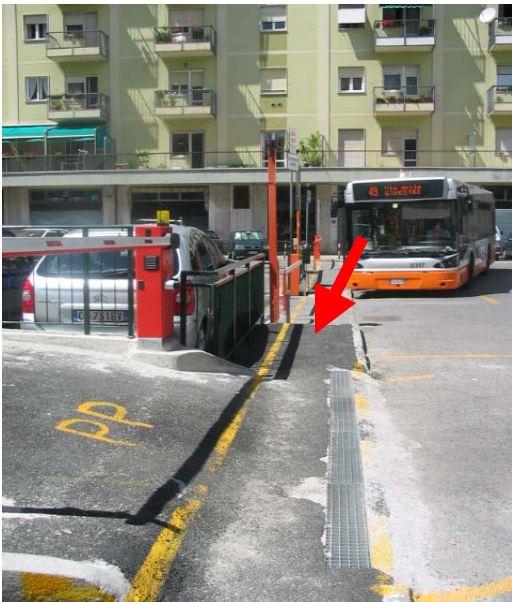
Vista lato mare-monti