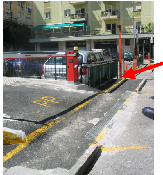
Vista lato mare-monti