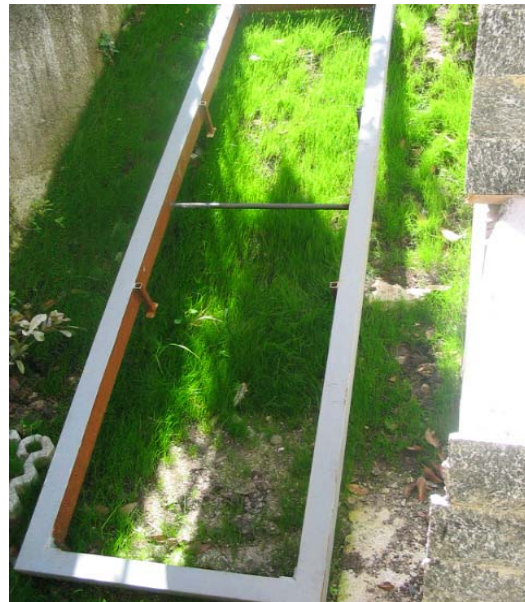
Telaio della vecchia Cabina