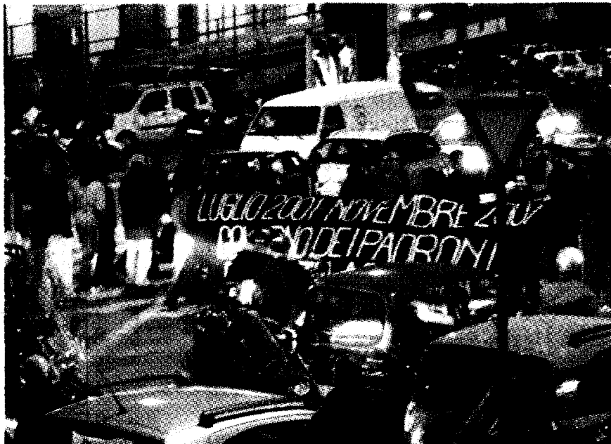
Il blocco del traffico degli anarchici in piazza Cavour

Una protesta dura e decisa ma ordinata quella dei cinquanta anarchici genovesi durata poco più di un'ora ed in mezzo allo shopping natalizio. I disagi maggiori si sono avuti dal punto di vista della circolazione stradale rimasta paralizzata per il corteo nel centro cittadino