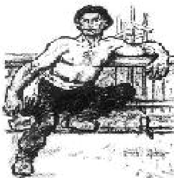
Angelo Oliviero Olivetti.

In questa frase, è possibile trovare sintetizzato tutto il pensiero di uno dei massimi teorici del sindacalismo rivoluzionario italiano: Angelo Oliviero Olivetti . Originario di Ravenna, dove era nato nel 1874, si era avvicinato ben presto alle idee del socialismo di fine Ottocento, restando inizialmente suggestionato dal pensiero di Karl Marx. Tuttavia, proprio partendo dall’analisi critica del marxismo, egli finì con l’approdare al sindacalismo rivoluzionario e poi a teorizzare una sintesi tra questo ed il nascente movimento nazionalista. Sin da giovane cominciò a maturare le ragioni del distacco critico dal marxismo e la frattura con la casa madre del socialismo. Un travaglio documentato in un’opera del 1906, “Problemi del socialismo contemporaneo”, con cui segnava il suo netto distinguo dalle componenti del massimalismo socialista e si avvicinava al sindacalismo rivoluzionario di Corridoni e De Ambris. Da Marx, Olivetti derivava la concezione di una rivoluzione del proletariato come conseguenza della rivoluzione borghese sorta a partire da quella francese.