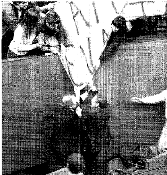
Tensione a Tursi, giovedì scorso, durante l'"invasione" di un gruppo di giovani no-global nel corso della seduta di consiglio comunale