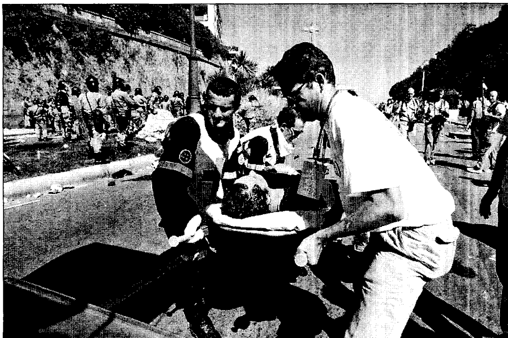
I soccorsi a un manifestante picchiato durante le cariche di sabato 21 luglio 2001