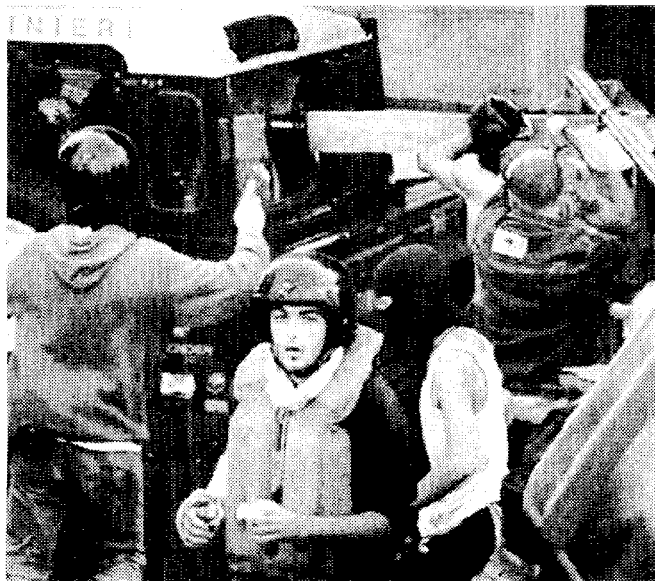
L'assalto alla camionetta dei carabinieri in piazza Alimonda