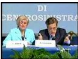
Il Centrosinistra di Veltroni