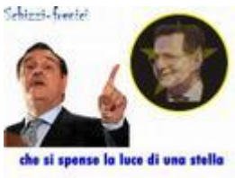
Questione di cottura

Povera Patria...Prodi Veltroni Partito Democratico Buffoni