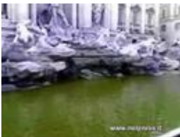
Fontana di Trevi verde come la bile di Veltroni