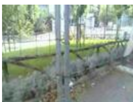
VIDEO DENUNCIA - Guardate come Veltroni tiene "pulita" Roma

Degrado di Roma...spazzatura traffico smog sporcizia buche e tutto quello che il Sindaco Veltroni sembra non vedere in un video .