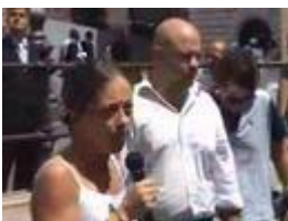
Azione Giovani - Rivolta Generazionale

OCCUPAZIONE ABUSIVA AUTORIZZATA DA VELTRONI A CORSO ITALIA...Bottini Municipio Roma Veltroni Chiappetti Circoli della Libertà Berlusconi Brambilla