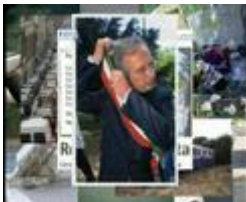
VELTRONI ROMA DANCE

NO AL RITORNO DEL NANO BUGIARDO E MAI PROCESSATO