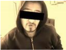
MESSAGGIO PER WALTER VELTRONI..

tutta la programmazione Rai - http://www.rai.tv... Maurizio Crozza fattore Casini Veltroni PD CDU Floris Ballarò Rai Tre sketch parody