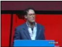
Guzzanti, millenovecentonovantadiecì - Veltroni

Highlights del presidio tenutosi a Roma, in via Bravetta, per protestare contro il sindaco Walter Veltroni e per la giunta di centrosinistra del Comune di Roma e per chiedere lo sgombero immediato del Residence Roma, covo di criminalità e di degrado, oggetto di false promesse e di continue bugie di Veltroni, il sindaco nemico dei romani.