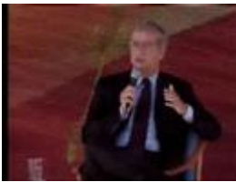
Veltroni rosica alla festa di Atreju, scherzi in diretta

Puntata di Striscia andata in onda Lunedì 8 Ottobre. Sopralluogo di Jimmiy Ghione al deposito Ama di Rocca Cencia per vedere le lavacassonetti costate 8.400.000,00 euro abbandonate e con pochi Kilometri percorsi. In realtà ,o spreco relativo alle lavacassonetti è di oltre 25.000.000,00 di euro se si considerano tutte le voci di spesa riportate sul contratto di servizio che ci vengono imputate con la tassa sui rifiuti. Uno scandalo che vi avevamo mostrato nei mesi scorsi, ora alla ribalta sulle cronache nazionali. Presto seguiranno importantissimi aggiornamenti sul disastro dell'Ama S.p.a. e sulle gravissime responsabilità del Sindaco Veltroni. Finora abbiamo certificato uno spreco di oltre 50.000.000,00 di euro. Guarda le nostre precedenti inchieste.