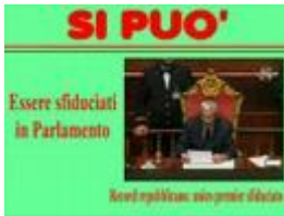
Si può fare

Spot amatoriale del Popolo della Libertà sui disastri del Governo Prodi...si può fare governo prodi popolo libertà veltroni