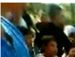
10/5/2007: ennesimo sgombero di rom romeni a Roma

Azione Giovani Rivolta Generazionale, video della manifestazione di Luglio 2007. Basta cazzate! Intervento di Giorgia Meloni. Basta Prodi, Veltroni, D'alema, Rutelli, Melandri, Ferrero, Bertinotti, Mastella, Fioroni, Fassino e tutto il cucuzzaro d'incompetenti!