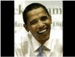
Walter Veltroni - il Falso Obama