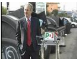
Veltroni e lo sfondo elettorale

Prime contraddizioni elettorali per il leader del Pd. Il tutto avviene durante la puntata di Porta a Porta per. Nel salotto televisivo di Vespa l'ex sindaco di Roma, stuzzicato dalle domande del direttore de Il Giornale, cade in forte contraddizione su tasse e gestione dei rifiuti.