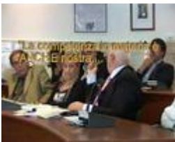
OCCUPAZIONE ABUSIVA AUTORIZZATA DA VELTRONI

video piuttosto profetico.....guzzanti veltroni pds ds pd democratico