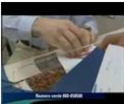
Le teorie di Veltroni. E la pratica

L'arte culinaria in politica....Prodi Veltroni