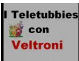
Walter Veltroni, ti piace vincere facile?

Stefano Disegni commenta le recenti goliardate satiriche "ai danni" di Walter Veltroni, da "Ballarò" a "Crozza Italia live". Tetris: ogni venerdì alle 23.50 (e il sabato alle 13) su La7.