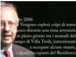
Santori - Un anno di bugie di Walter Veltroni sul Residence

Lo scherzo fatto a Walter Veltroni durante l'edizione 2007 di Atreju, la festa di Azione Giovani. Francesco Filini consigliere del Municipio 4 chiede al Sindaco notizie sulla Borgata Pinarelli che esiste solo nei film di Thomas Milian e Bombolo: Delitto in formula 1! Il futuro segretario del partito democratico, al contrario dei già "kazirati" Fini e Berlusconi non sembra gradire la goliardata fatta dai giovani di Alleanza Nazionale. Per un Sindaco che bada solo con alla sua immagine vedere questa messa in discussione da un semplice scherzetto lo fa andare in bestia... Pover'uomo!