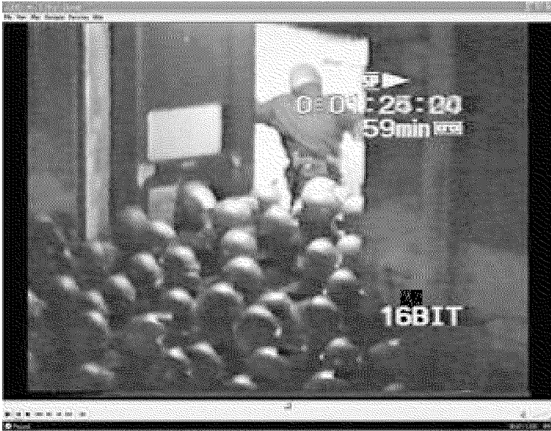
Il filmato dell'irruzione della polizia alla scuola Diaz, nel luglio del 2001