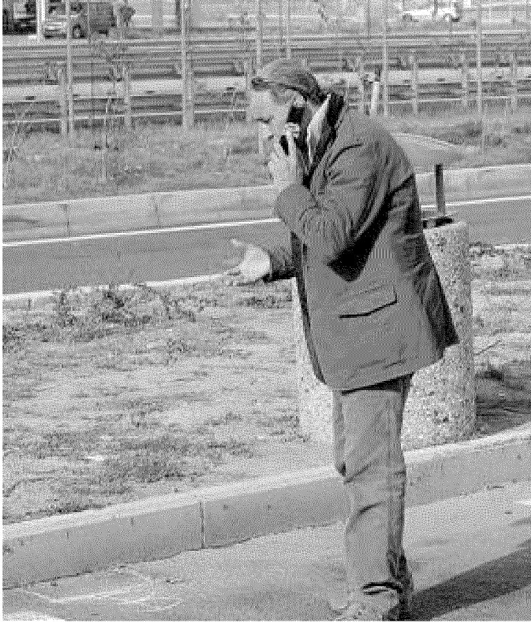
Il luogo dove sono stati trovati i bossoli dei colpi esplosi dall'agente della polizia stradale. A sinistra in basso sono indicati con il gesso