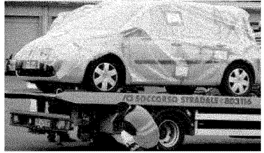
La Megane Renault viene caricata su un carro-attrezzi dell'Acì per essere portata in un garage dove saranno effettuati i rilievi balistici