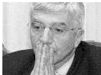
Gianni De Gennaro