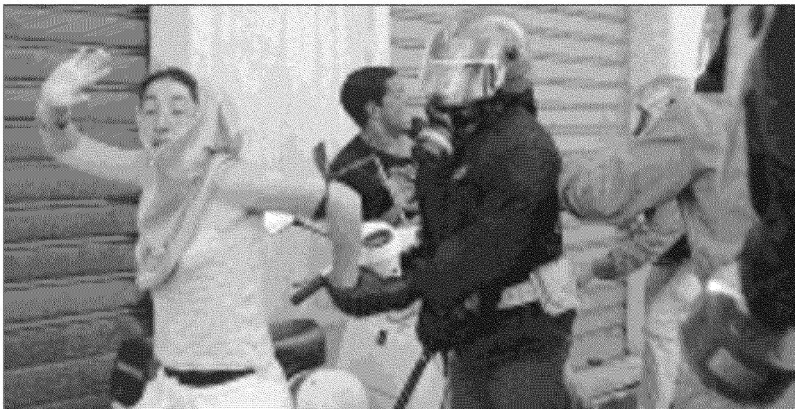
Sconcertante presa di posizione dello stato che non vuole risarcire i manifestanti picchiati dalla polizia