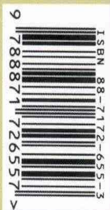
Retro della Copertina Pubblicazione

Consigliere Circoscrizione IV Valbisagno