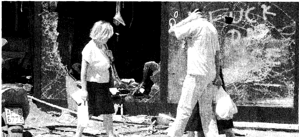
Curiosi e devastazioni in corso Marconi dopo il G8 del luglio 2001