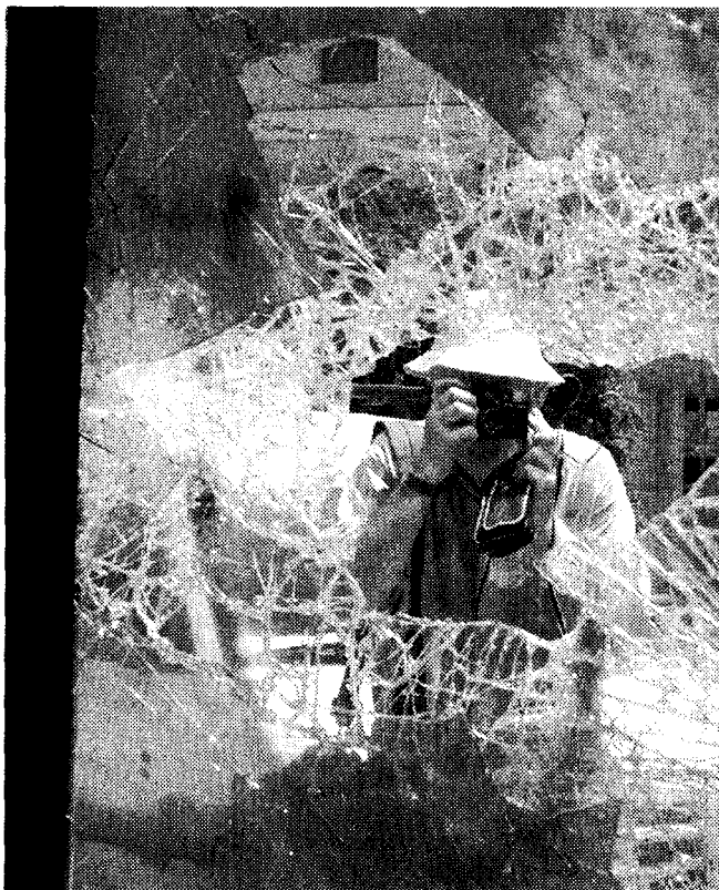
La vetrata infranta dai contestatori in nero

Un grave danno di immagine per l'Italia la devastazione di Genova compiuta dai Black bloc