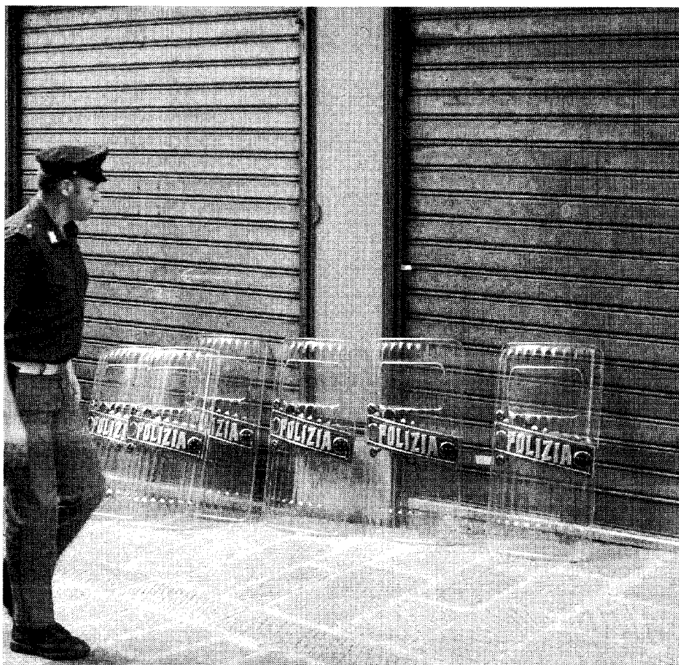
Saracinesche chiuse e scudi antisommossa della polizia durante il G8