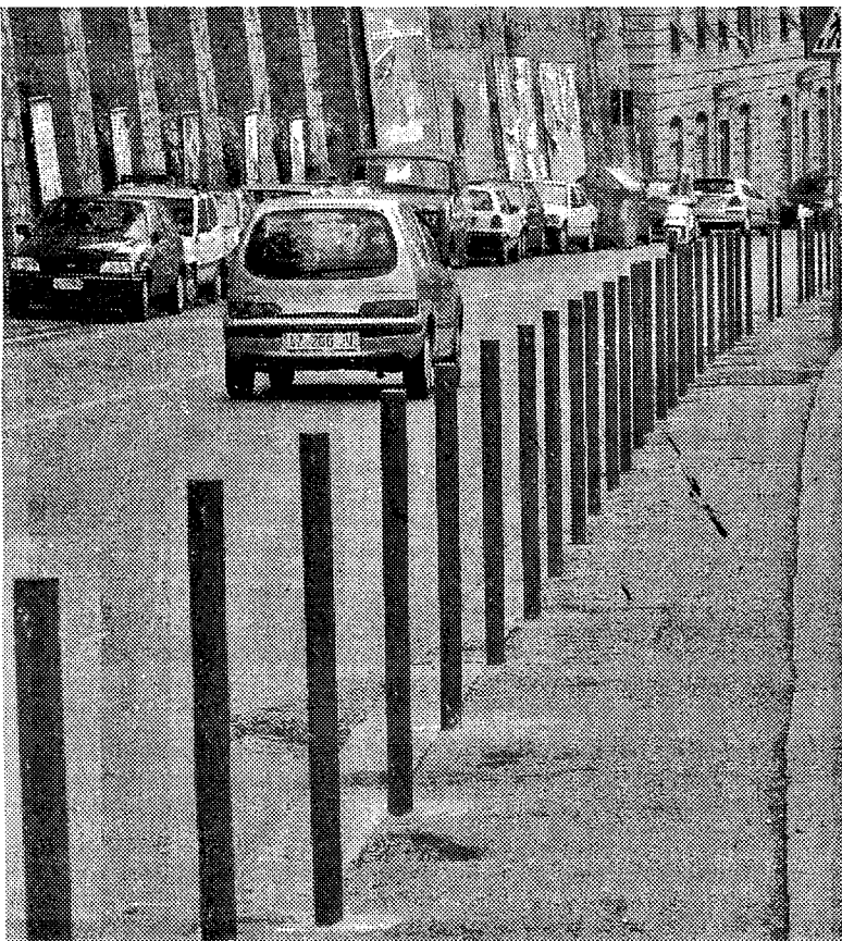
Paletti dissuasori in via Montaldo, vicino a Marassi