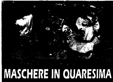
MASCHERE IN QUARESIMA

Prima le polemiche, poi rinvio per pioggia