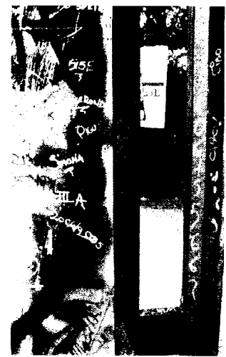
I PANNELLI «LIBERI» per gli insulti dei grafomani