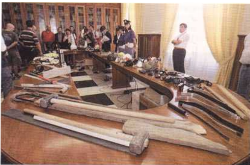
Gli oggetti mostrati alla stampa. In primo piano, gli attrezzi utilizzati dal cantiere edile aperto nella scuola Pertini.

Ho visto la scena in televisione. Ricordo, mentre si stava chiudendo il servizio, di aver udito la voce fuori campo di un giornalista che diceva: "Sentite, in tasca ho un coltellino svizzero, che fate, arrestate anche me?".