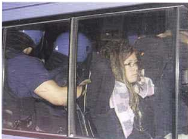
Una ragazza fermata sul cellulare della Polizia. Probabile destinazione: Bolzaneto.