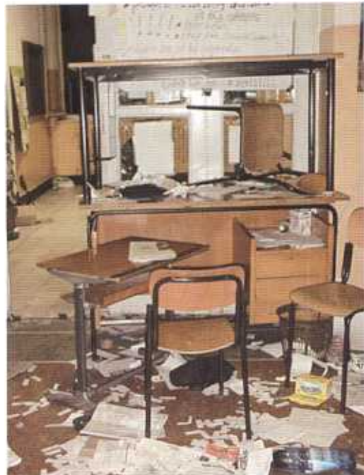
La palestra (sopra) e un'aula della scuola Pertini, fotografate dopo.