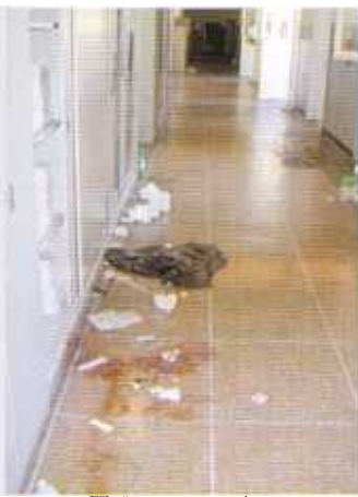
Il corridoio sporco di sangue del piano superiore. Sulle scale, il sangue formava delle scie.

La gravità della violenza compiuta durante il blitz, sul cui accertamento la Commissione parlamentare rimanda all'azione dell'Autorità giudiziaria, è dimostrata indirettamente da un semplice calcolo: il rapporto tra gli accessi e i ricoveri al Pronto Soccorso di San Martino, nel pomeriggio del sabato, è di circa 1 a 9 (ossia un ricoverato ogni nove giunti in ambulanza), mentre per la notte del blitz supera il rapporto di 2 a 3.