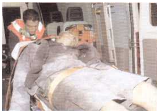
Un ferito esanime caricato in ambulanza. L'intervento dei sanitari - a loro detta - è stato in molti casi provvidenziale.