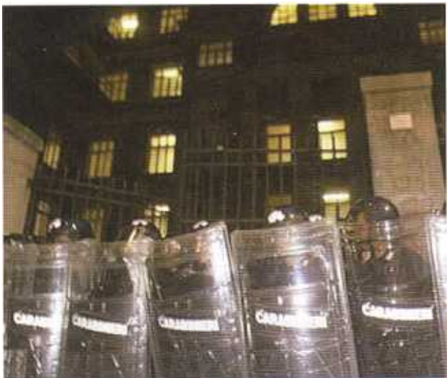
L'edificio della scuola Pertini, come si presentava la notte fra sabato 21 e domenica 22 luglio.

Via Battisti è una strada stretta, a senso unico, situata fra via Trento e via Nizza, da cui si domina punta Vagno. È una strada in genere piuttosto frequentata, perché vi si affacciano due complessi scolastici, quello del liceo psico-pedagogico Pertini, un edificio che risale ai tempi del Fascio, di proprietà della Provincia, e quello della elementare Diaz e della media Pascoli, un edificio più recente, gestito dal Comune.