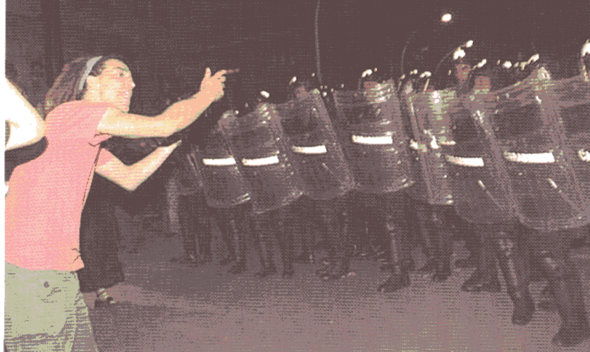
Un cordone di carabinieri protegge la perquisizione dall'ira della folla. Alla fine saranno proprio loro a dover essere difesi, quando si potrà entrare dentro e vedere.