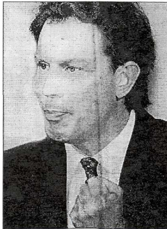
Tony Blair, primo ministro della Gran Bretagna