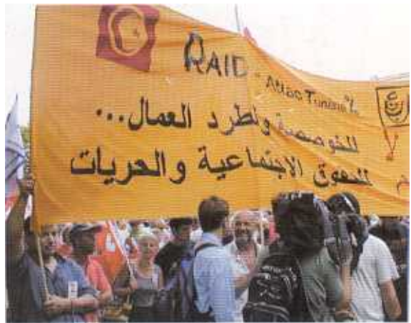
Nell'ordine: peruviani, tunisini, marocchini, curdi e russi.