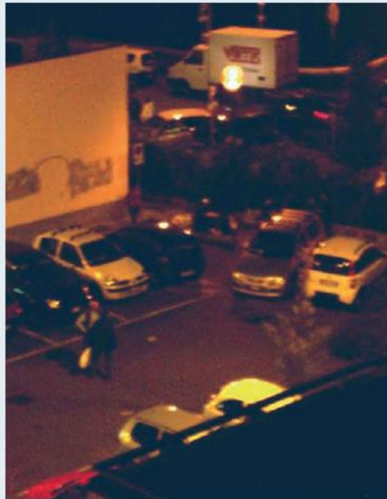
RISSE E «VENDITA» DI SCHIAVE DEL SESSO. Alcune immagini scattate a distanza dai pensionati delle ronde. Nella foto grande una donna vicino a un palo attende la conclusione della trattativa. Nelle altre foto il gruppo di romeni presidia l'area del supermercato

una piccola agenda - abbiamo scoperto che 2 o 3 donne di quella banda, le più giovani e piacenti, dopo essere state allontanate dai supermercati davanti ai