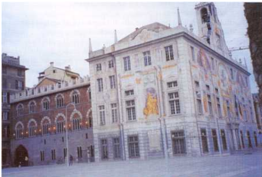
Palazzo San Giorgio, un tempo sede delle potenti corporazioni dei commercianti marittimi genovesi, alla luce della sera del 18.

- Carina, merita. Tu non ci sei ancora andato, vero?