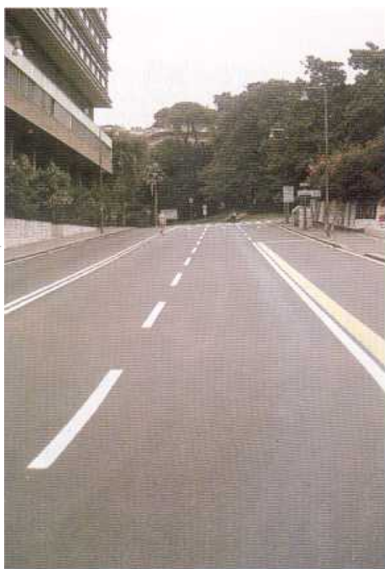
Via XII ottobre, dal bivio di via Pammatone, dove hanno sede il Comando Centrale della Polizia Municipale ed il Tribunale (chiuso).

Arrivo a Corvetto: è una trincea, un fortino. Insieme a me ci sono alcuni ragazzi, una coppietta, due pensionati e una signora con il cane. Si sta discutendo al varco di via Santi Giacomo e Filippo. Due poliziotti stanno spiegando che quello è sì un varco, ma militare, non pedonale; lo apriranno soltanto per far passare i mezzi delle Forze dell'ordine.