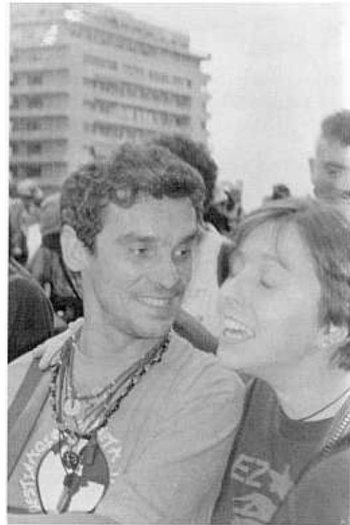
Il cantante Manu Chao in piazzale Kennedy, perplesso sulle qualità canore di una ammiratrice.