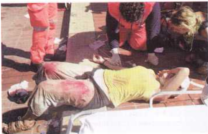
Una manifestante curata sul marciapiede di corso Italia, davanti a punta Vagno, nel tardo pomeriggio del 21.

Più avanti, sulla base dell'esperienza dei giorni di Genova, un nucleo di avvocati avrebbe costituito il Genoa Legal Forum, che tuttora segue gli aspetti legali della vicenda. I medici e i sanitari del GSF, dal canto loro, avrebbero pubblicato un libro di testimonianze, dal titolo: "Obbligo di referto", uscito nel successivo mese di ottobre.