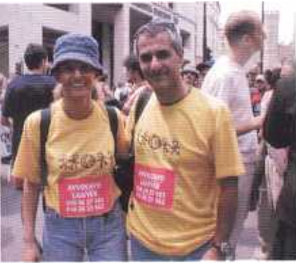
Una coppia di avvocati del GSF in piazza Dante, nella mattina del 20.

Si dirà in seguito che una delle colpe da addebitare al GSF è stata la carenza di organizzazione. Gli stessi responsabili del GSF ammettono che non tutto è andato come previsto, tuttavia insistono sul fatto che in almeno due punti l'organizzazione ha funzionato a dovere: nel servizio legale e in quello sanitario.