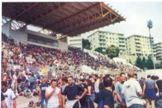
Lo stadio Carlini si riempie.

Da domenica 15 chi viene a Genova e si mette nelle mani del GSF arriva a piazzale King - Vittorio Veneto e lì trova il Punto di Convergenza con gruppi di volontari o di appartenenti a varie organizzazioni, che gli forniscono informazioni generali; viene quindi indirizzato nei centri di accoglienza già pronti (o che man mano diventano pronti, visto che alcuni, per i tempi ristrettissimi, sono consegnati solo il giovedì).