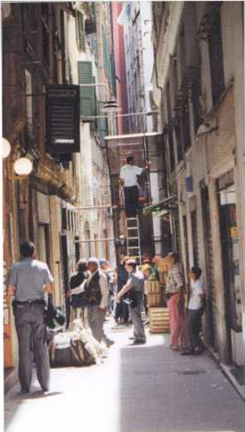
Genova - dice un mio amico sardo - è una città fatta in verticale...

La blindatura di piazza Portello. La chiusura delle due gallerie che collegano la stazione Principe con la stazione Brignole, passando da Corvetto, fu la causa determinante della rivoluzione nel traffico genovese. Fu imposta dalla Questura nel timore che i manifestanti potessero nascondersi all'interno delle gallerie.