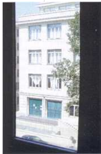
La scuola Pascoli, dove era stato allestito il Media Center, ripreso da una finestra del secondo piano della scuola Pertini.

Mancano ancora due siti: la scuola Govi di via Cavallotti, dove viene collocato il Laboratorio teatrale, e soprattutto il complesso delle scuole di via Cesare Battisti: nella scuola Diaz/Pascoli (rispettivamente una elementare e una media) vengono situati il Centro stampa e gli uffici del GSF, nella scuola Pertini (un liceo socio-psicopedagogico), sulla cui facciata sta scritto Scuole Diaz , viene utilizzata all'inizio solo una sala adiacente alla palestra del pianterreno, dotata di alcuni computer e chiamata People's House. Alla palestra del pianterreno si accede direttamente dal cortile. Nell'estate del 2001, la scuola Pertini era circondata dai ponteggi di un cantiere edile.