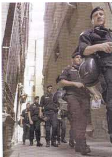
Un'immagine rubata da una pattuglia, nei vicoli dietro palazzo Ducale.