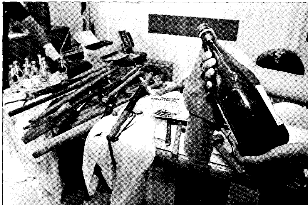
Una delle molotov al centro del caso delle prove false alla Diaz. In basso, il pm Francesco Pinto

Mortola telefona a Pinto. Nell'interrogatorio del 23 luglio 2002 a Spartaco Mortola, responsabile della perquisizione alla Diaz, il funzionario sparaccia il nome di Pinto: sostiene che il collega Ferri gli ha detto di aver parlato al telefono col pm, mettendosi d'accordo sul luogo dove raccontare di aver trovato le molotov. Ma Mortola inesplica, bofonchia, tratta subito: «Mi sono sbagliato, ero confuso». Poco importa, dico-