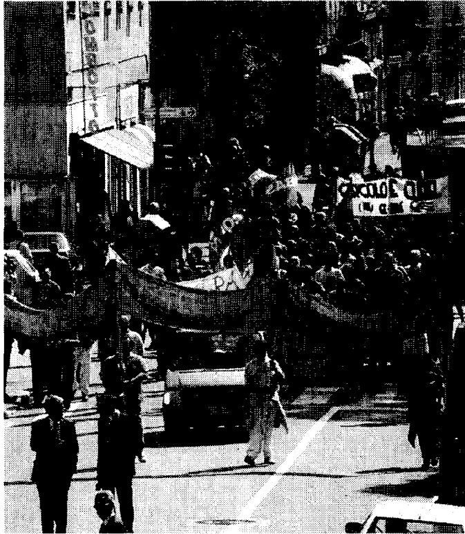
La manifestazione organizzata davanti alla caserma

I generali hanno anche risposto e illustrato ai pm l'organizzazione che era stata creata per accogliere la "masa" di fermati durante gli scontri. Se ne prevedevano seicento in tre giorni, ma per fortuna le previsioni sono state largamente sbagliate (di almeno due terzi). Nell'ambito di questa inchiesta sono una novantina i componenti delle forze dell'ordine già indagati per abuso di autorità contro i manifestanti arrestati o detenuti. Non per tutti è scattato l'avviso di garanzia perché per moltissimi la posizione è veramente marginale e l'iscrizione è stata determinata solo dal fatto della