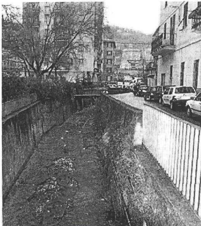
Presto al via i lavori lungo il rio Cicala

Il tombinamento del rio servirà ad allargare la strada di fossato Cicala, strettissima e angusta, e quindi ad avere dei parcheggi lungo essa. In più proprio in prossimità dei giardini dove un tempo c'era la concimaia comunale, ormai da tempo dismessa verrà