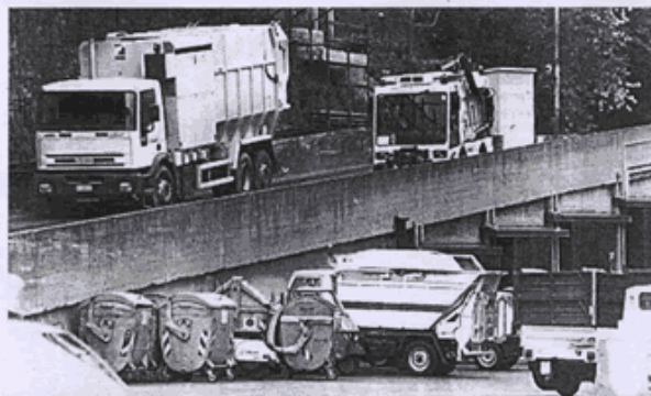
Il trasferimento di attività della Volpara alla casa Zanacchi viene contestato dai residenti della zona